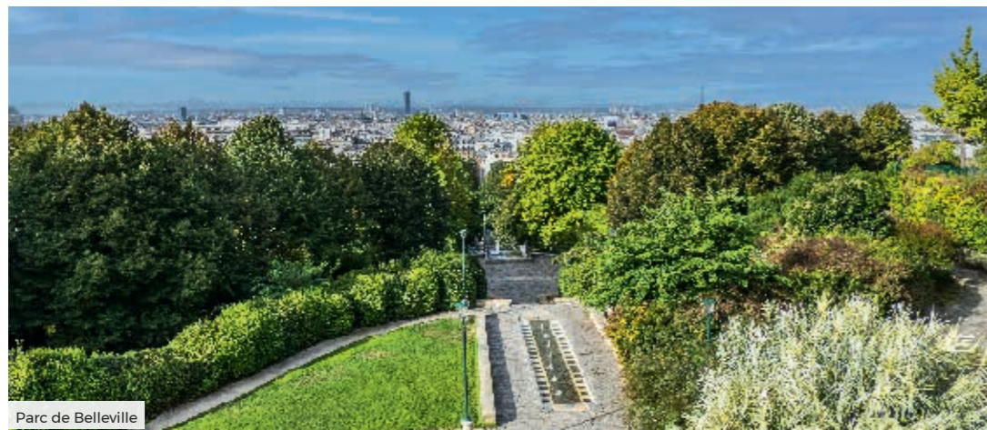
Parc de Belleville