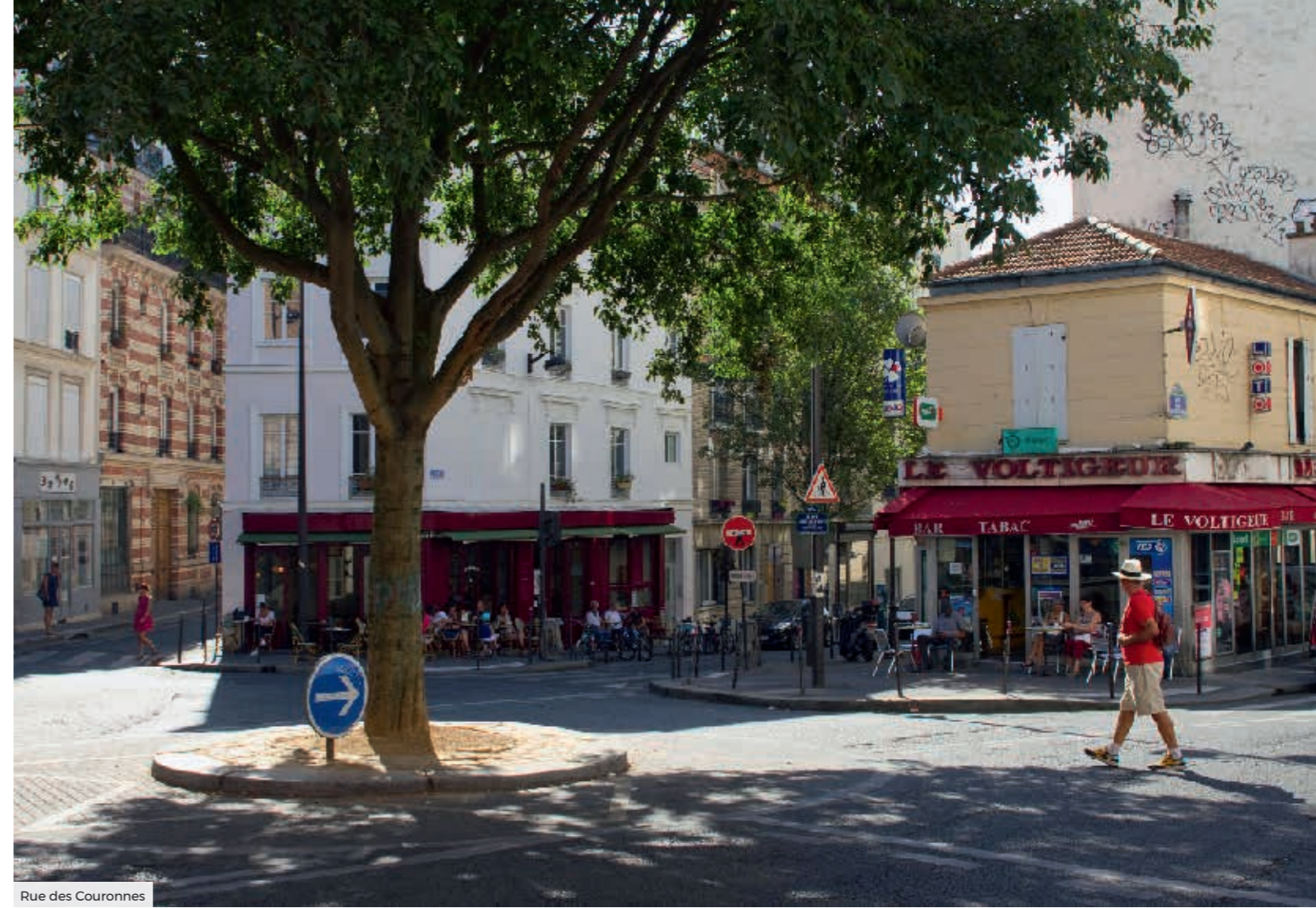
Rue des Couronnes

Au calme de la rue Boyer et à proximité de l'attractive rue Ménilmontant, le quotidien est à la fois pratique et épanouissant.